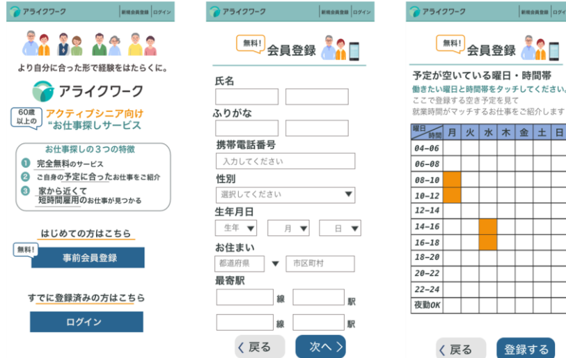
ユーザーによる登録画面イメージ

このような状況を受け、「アライクワーク」の『マッチング支援サービス』では「はたらきたい日時」を2時間単位で登録可能としています。アクティブシニアであるユーザーは「はたらきたい日時」を登録することで自分の都合にあった仕事のオファーを受けることができます。企業側は、ユーザーの「はたらきたい日時」が集約されたデータベースの中から、条件（最寄り駅、日時）が合致するユーザーへ採用オファー依頼を出すことができます。これにより「場所」と「時間」のミスマッチを解消し、精度の高いマッチングを実現します。