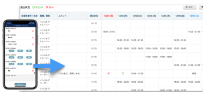
▲シフト希望の収集