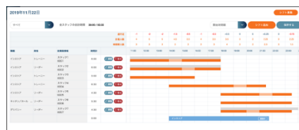
▲シフトの作成・確定