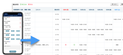
▲シフト希望の収集